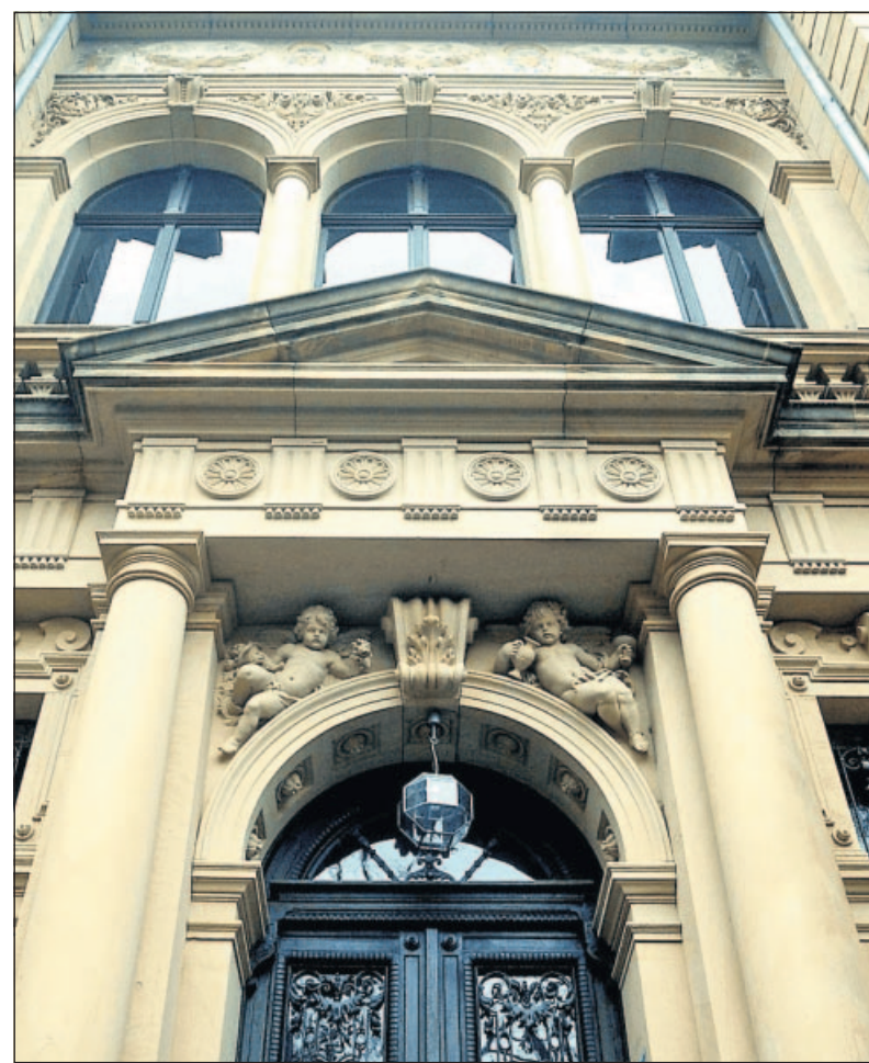
Der Sandsteinbau in neuem Licht: Die Villa Böhm wird während des Rheinland-Pfalz-Tages in den Abendstunden illuminiert.