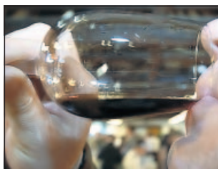
Im Rathaushof dreht sich alles um den Wein.

Die Weindörfer präsentieren ausgewählte Weine, begleitet von erlesenen Speisen des „Mundus Vini“-Weinhauses. „La Macchina per caffè“ serviert Kaffeespezialitäten. Im Rathaus ist eine den einzelnen Ortsteilen gewidmete Fotoausstellung zu sehen. Und ganz bestimmt besteht die Chance, die Weinhoheiten aus Diedesfeld, Duttweiler, Geinsheim, Gimmeldingen, Haardt, Hambach, Königsbach, Lachen-Speyerdorf oder Mußbach kennenzulernen. Die Öffnungszeiten: Freitag, 11. Juni, 16 bis 0.30 Uhr; Samstag, 12. Juni, 11 bis 0.30 Uhr; Sonntag, 13. Juni, 11 bis 22.30 Uhr.