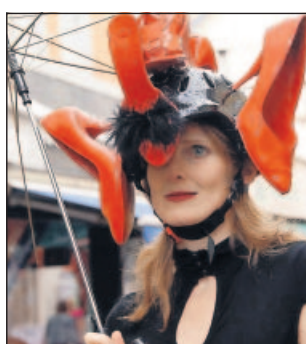
Schräg und spannend: das Hofkultur-Programm.