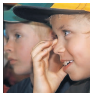
Sehen, staunen, mitmachen: die Kindermeile.

11-19 Uhr: zusätzlich zu den Angeboten vom Freitag: Stockbrot am Lagerfeuer (Deutsche Wanderjugend), Verkauf Hirschkraut-Burger (Deutsche Pfadfinderschenschaft St. Georg), Bootsfahrt auf dem Floßbach (CJD Neustadt), Elwetritsche Drucken (Kreativschule art) ab 11 Uhr: Aufführungen von Kinderchören und Tanzgruppen (Grundschule Ostschule, Schubertschule, Grundschule Mußbach und Gimmeldingen).