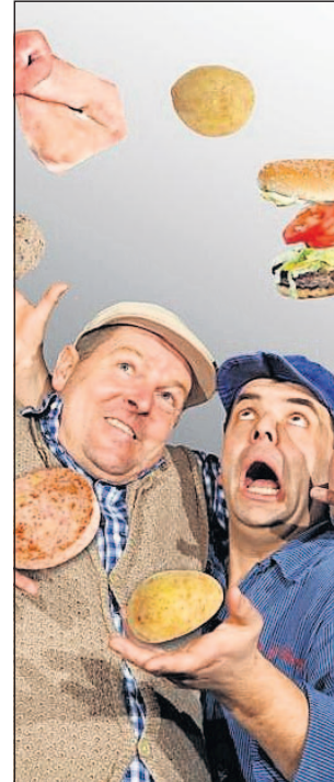
Pälzisch, luschedisch: Spitz und Stumpf.

17-17.45 Uhr: „Délacies d'amour“ – Lyrik, Szenen und französische Chansons mit Mitgliedern der Neustadter Schauspielgruppe. 18-18.45 Uhr: „Kunterbunt“ – Schüler der Pfälzer Musikschule Neustadt zeigen Kostproben ihres Könnens.