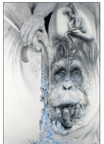
Groteske Fantasie: Zeichnung von Andreas Hella.