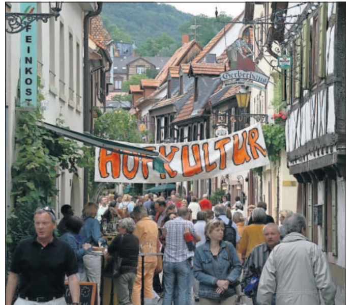
Volles Kunstprogramm: In den Altstadtgässchen.

Im Hof der Hintergasse 19 hat die freie Theatergruppe „Dramatische Hoftheater“ Quartier bezogen. Gezeigt wird am Samstag, 12 und 17 Uhr, sowie am Sonntag, 11.30 und 17 Uhr, eine „kurzkomische Variante der Nibelungen-Saga“. „Die Nibelungen und ihre Lieder“ sind gespickt mit Schlagern vergangener Jahrzehnte, kündigen die Schauspieler an. Am Samstag um 14, 18 und 20 Uhr tritt außerdem die Improtheater-Gruppe „Wer wenn nicht vier“ in der Zwerchgasse mit ihrem heiteren Spiel auf. Bei der Hofkultur mit dabei ist auch Rheinpfalz-Maskottchen Nils Na-